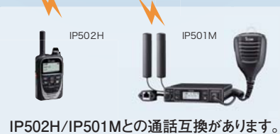
IP502H/IP501Mとの通話互換があります。