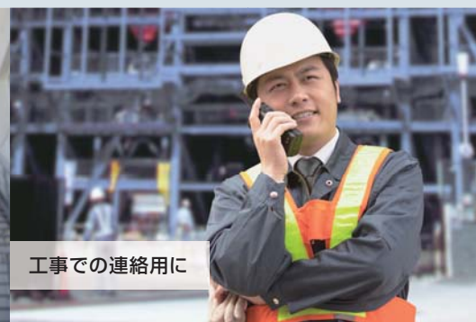
工事での連絡用に