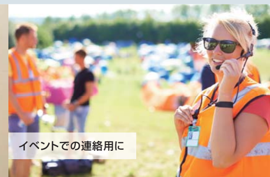
イベントでの連絡用に