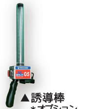
▲誘導棒 *オプション