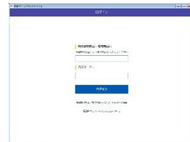
図 2: 建レコ※アプリログイン画面