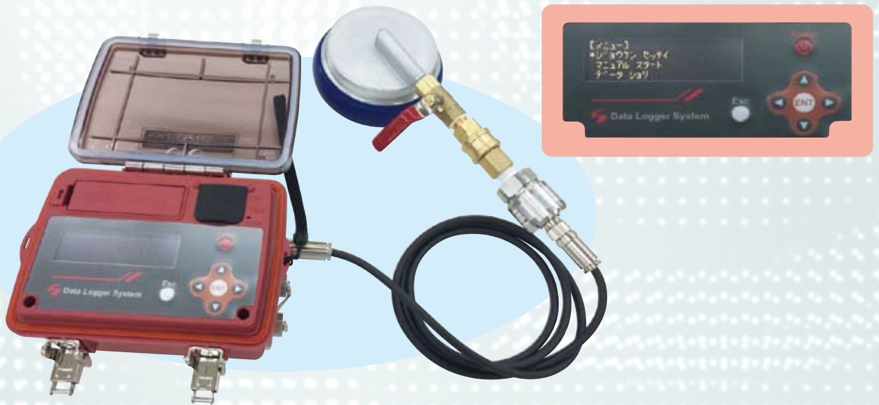
水圧・流量測定表示グラフ