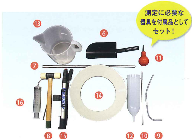
付属品 6 ハンドスコップ 10 シール棒 14 生コン充填用ハット 7 突き棒 11 スポイト 15 空気入れ 8 ハンマー 12 500 cc 給水ポット 16 空気校正用注射器 9 排水管 13 3,000 cc 給水タンク