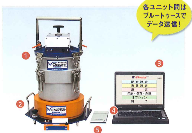
W-Checker 本体 1 高精度デジタルエアメーター 2 秤 演算装置 3 パソコン 4 Bluetooth アダプター 5 プリンター