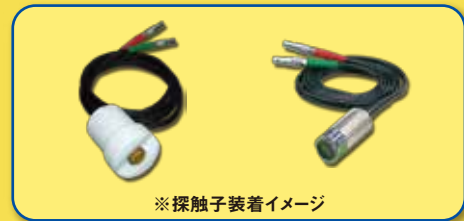
※ 探触子装着イメージ