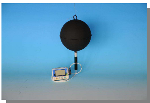
ロガー付グローブ温度計 PGT-02