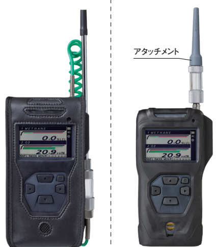
レーザーカバー[C-37] 汚れや傷から本体を保護します。 アタッチメント [AT-2B]