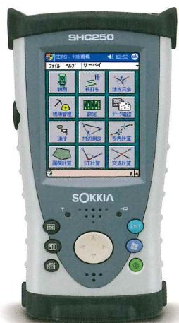
データコレクター SHC250