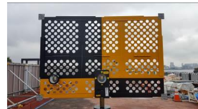
専用ターゲットによるキャリブレーション