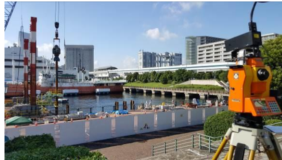
カメラ付きトータルステーションの設置