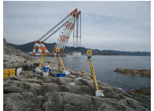
ケーソン据付への適用事例