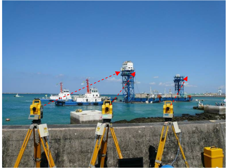
沈埋函据付への適用事例