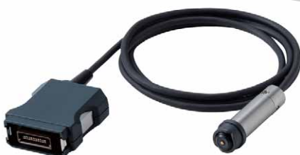
SWT-NEOシリーズ専用プローブ SFN-325