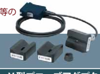
V型プローブアダプタ