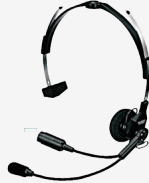
SSM-62H インターコム型 ヘッドセット