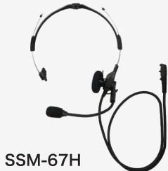
SSM-67H インターコム型 ヘッドセット