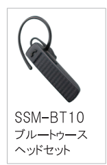
SSM-BT10 Bluetooth ヘッドセット

オプションの Bluetooth ヘッドセット SSM-BT10 を使用したワイヤレス通信が可能です。SSM-BT10 はノイズキャンセル機能によるクリアな送信音質で業務連絡をサポートします。SSM-BT10 は一度の充電で約 20 時間使用することができます。(使用時間は、同時通話連続運用時を想定)