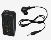
SSM-516H マイク&イヤホン (本体接続型マイクロホン) ・イヤホン付属