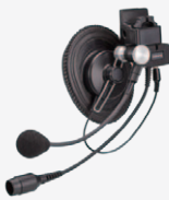
SSM-61H 工事ヘルメット用 ヘッドセット