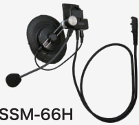
SSM-66H 工事ヘルメット用 ヘッドセット

※親機など、常時同時通話で運用する場合に便利です。(通話ボタン/CUEボタンはありません)