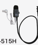
SSM-515H タイピンマイク &イヤホン