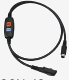
SCU-49 ヘッドセット接続ケーブル

*SSM-61H/SSM-62H/ SSM-50H使用時に接続して 本体に装着します。 *通話ボタン、CUEボタン装備