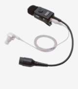
SSM-50H タイピンマイク &イヤホン