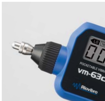
付属 (出荷時の状態)

VM-63Cの振動検出部は、測定用途によりアタッチメント(S、L、アタッチメントなし)を使い分けることができます。