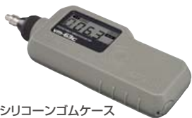
シリコンゴムケース 装着例