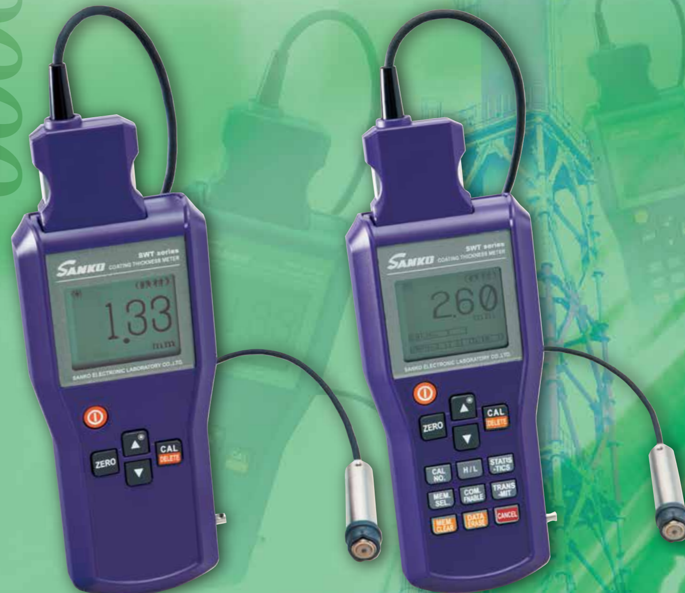
※写真は、SWT9000シリーズ本体に専用プローブ FN-325(別売)を接続しています。