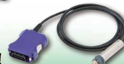
SWT-9000 シリーズ専用プローブ FN-325

デュアルタイププローブ新登場!! 鉄・非鉄の素地金属を自動判別 — FN-325