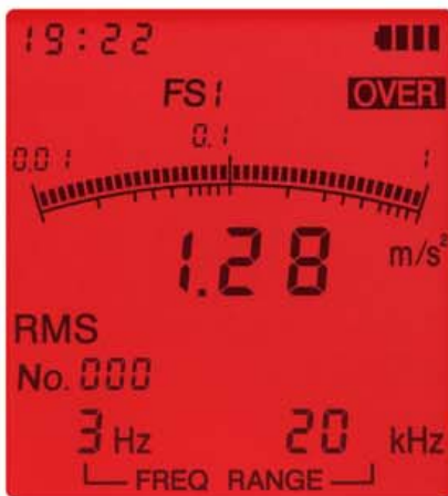
オーバーロード画面