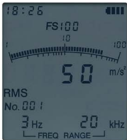
測定データの表示画面

液晶画面にはバググラフと数値が同時に表示され、変動の様子を容易に把握。設定した周波数範囲などの情報も表示し、バックライト機能により暗所でも内容を確認できます。オーバーロードの状態になると、OVERが表示され、液晶全体が赤色に変わります。