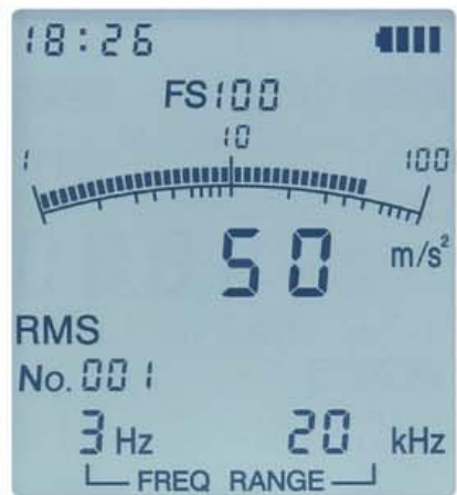
バックライトの点灯