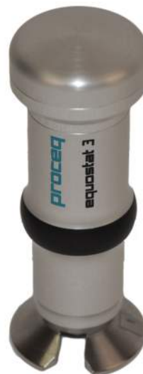
Portable Rockwell 専用プローブ