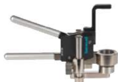
専用クランプ ※オプション品

小さいものや球状のものなど、固定が難しいものは専用クランプを使用することで測定ができます。対象物を挟み込む事で片手でも簡単に操作が可能。