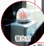
* 警告灯はオプションです。