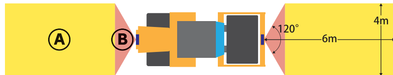
【検知範囲の設定例】