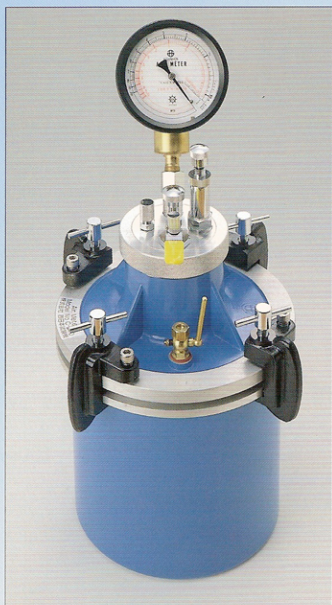
Model No. C-280