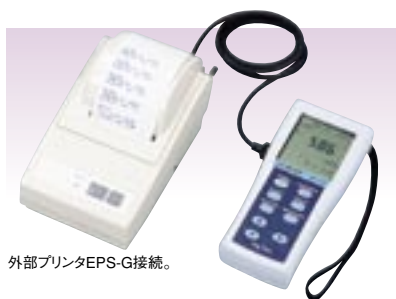
外部プリンタEPS-G接続。

よりスムーズなフィールド測定に、 オフィスでの測定や、 データ処理のニーズにお応えします。