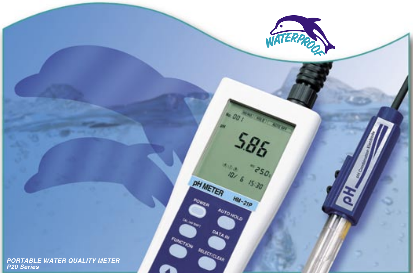
PORTABLE WATER QUALITY METER P20 Series