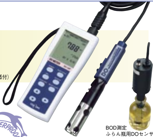
BOD測定 ふらん瓶用DOセンサ (OE-470AA)