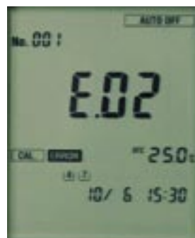
エラーナンバー表示例。