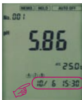
時刻の常時表示例。

ISO-14001/9001に取り組むお客様へ、バリデーション対応機能を提供します。