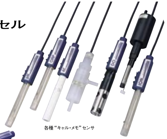
各種“キャル・メモ”センサ