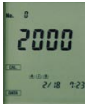
最新の校正日時表示例。

メモリー内蔵センサ「キャル・メモ」(一部センサ除く)採用により、過去の複数の校正結果(校正履歴)を表示することもでき、機器管理が適切に行えたかをチェックすることができます。