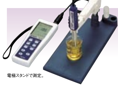
電極スタンドで測定。