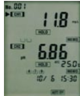
イオン・pH同時表示例 IM-22P型。

イオン・pH計、電気伝導率・pH計を用意しました。各測定値を独立して、同時に表示/測定できるので、2項目のリアルタイムな観察が可能です。