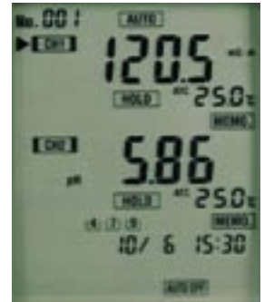
電気伝導率・pH同時表示例 WM-22EP型。