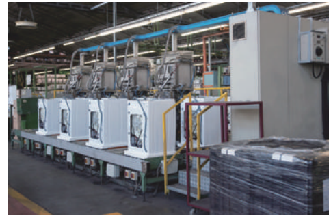
工場内の作業環境測定に