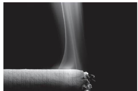
タバコ煙の測定に