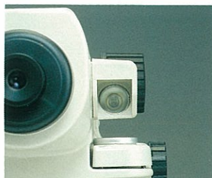
気泡管用ペンタミラー

視準の姿勢を変えずに、ちょっと視線をズラすだけで気泡像が見られる、気泡管用ペンタミラーを採用。像は左右そのままの正立像ですから、まぎらわしさありません。