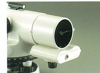
照明装置3型(オプション)

単三乾電池使用の簡単に使える照明装置。望遠鏡の先端に取り付けて、望遠鏡の十字線を照明します。