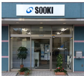
株式会社ソーキ 中部営業所