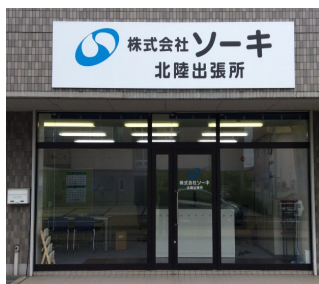
株式会社ソーキ 北陸出張所